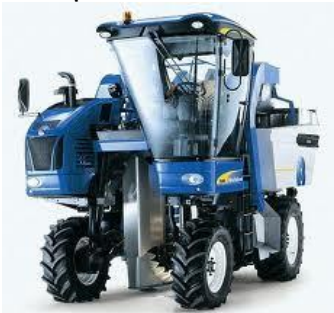
Sol. 1 : machine secoueuse qui ramasse tout ce qui tombe

L'espèce n'est pas à la mode : elle n'est pas durable, contrairement à la « comm », à la prévarication et aux impôts. Par quoi remplace-t-on le vendangeur ?